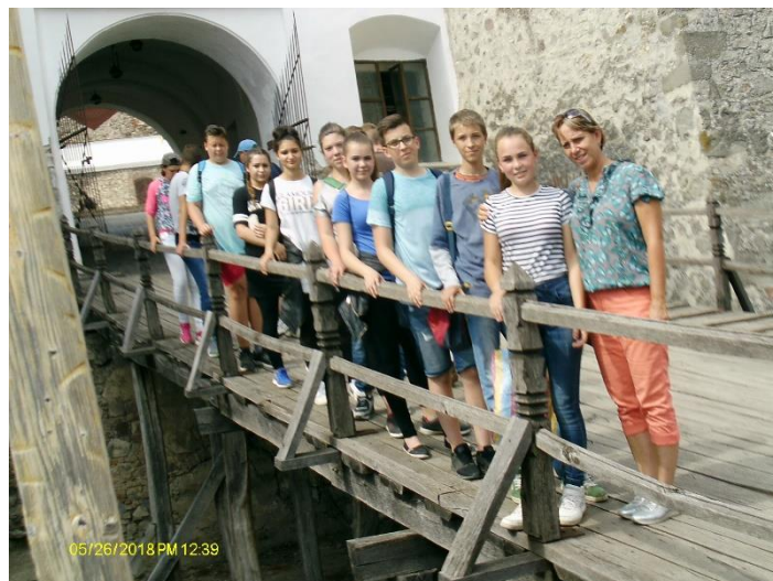
A vár bejáratánál

Innen Munkács várába vezetett utunk, ahol Zrínyi Ilona hősiességét idéztük fel, bejártuk a gyönyörű várat.