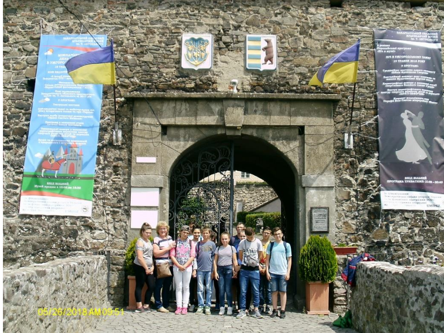
Az ungvári vár kapujában

Ungváron megnéztük a várat, majd a szomszédos Skanzenben folytattuk időutazásunkat, ahol Kárpátalja legjellegzetesebb népi építészeti alkotásaiban gyönyörködhettünk.