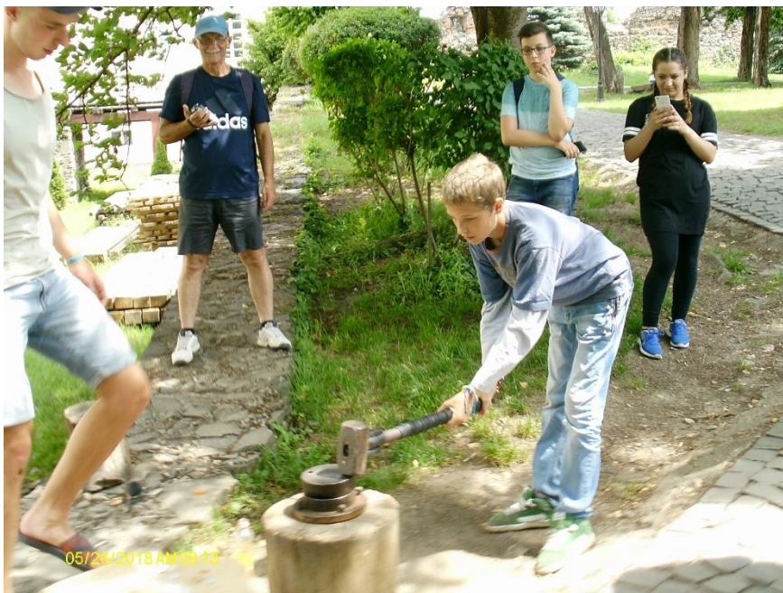
Ismerkedés a pénzverés tudományával