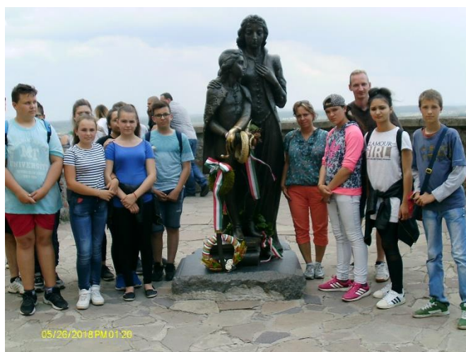
Zrínyi Ilona és Rákóczi szobránál